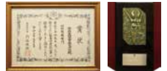
農林水産部ほ場整備部門 優良建設工事の賞状(左)と盾(右)