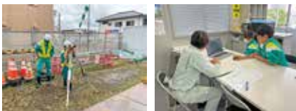
職場体験学習の様子 職場体験学習の様子

参加した生徒からは「貴重な経験をすることができ働くことの大変さや、やりがいを強く感じました」などの感謝の言葉が寄せられました。