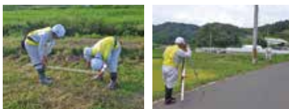
現場実習の様子 現場実習の様子

二本松実業高等学校都市システム科の2年生5名、実際の工事現場を見学し、測量したり重機の操作説明を聞いたりしたほか、当社の危険体感実技センターでは、バーチャルリアリティ技術を活用しCGで再現した重機との挟まれる衝撃感覚を疑似体験したり、カンケンフィットネスジムを見学して頂きました。