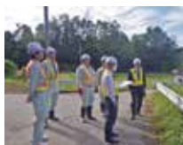
土木作業所での審査の様子