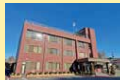
2025年元日の朝日を受ける当社社屋