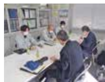
建築作業所での審査の様子